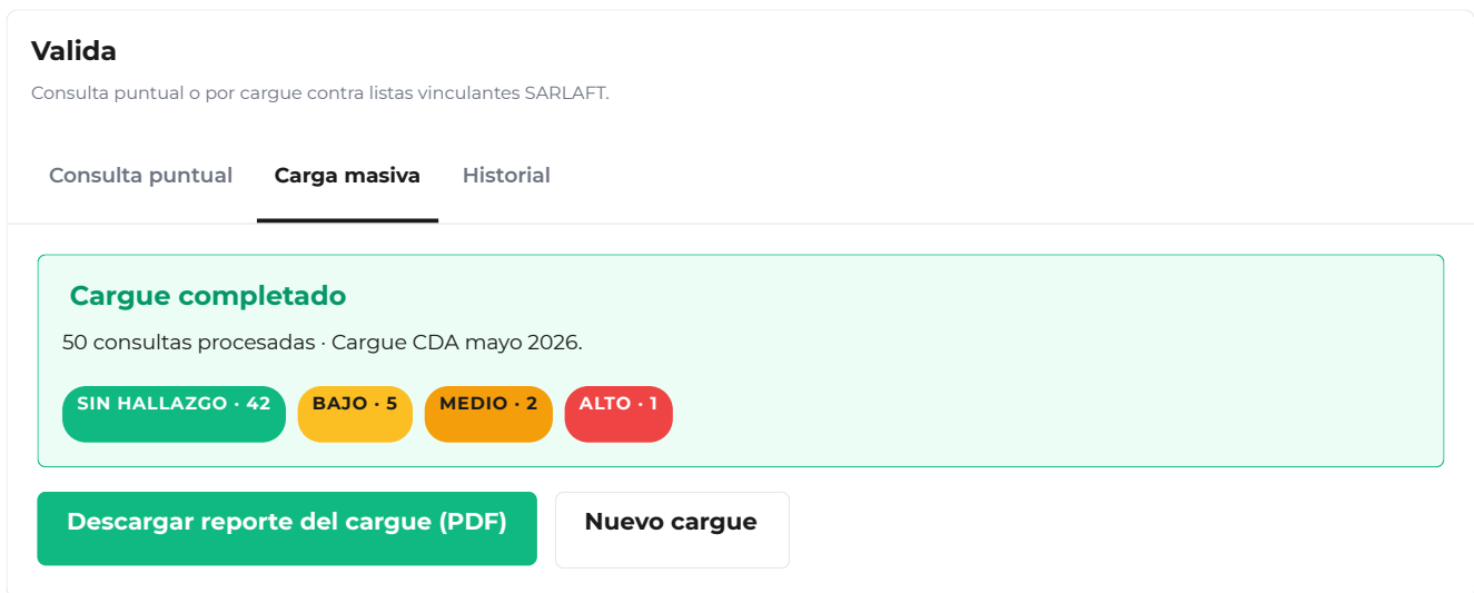
Figura 6. Resumen del cargue completado. El boton verde descarga el reporte PDF agregado.